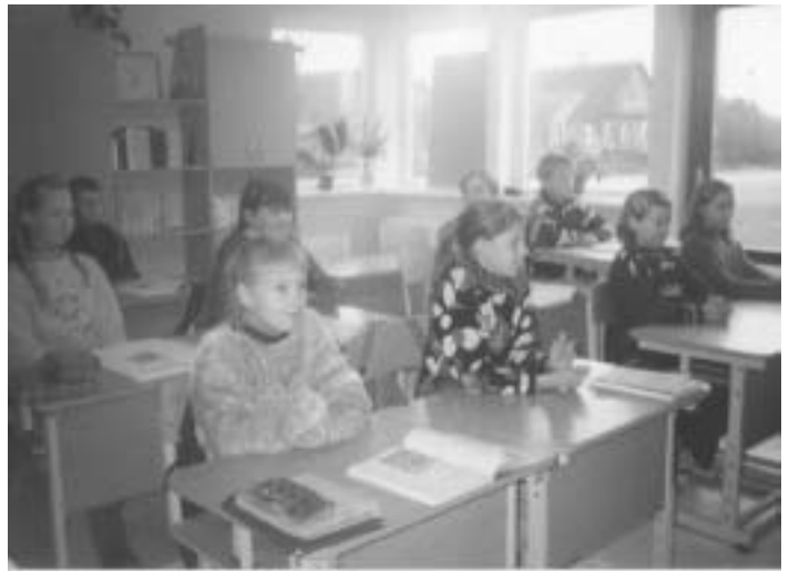
Lavoriškių mokyklos mokiniai džiaugiasi savo naujomis patalpomis