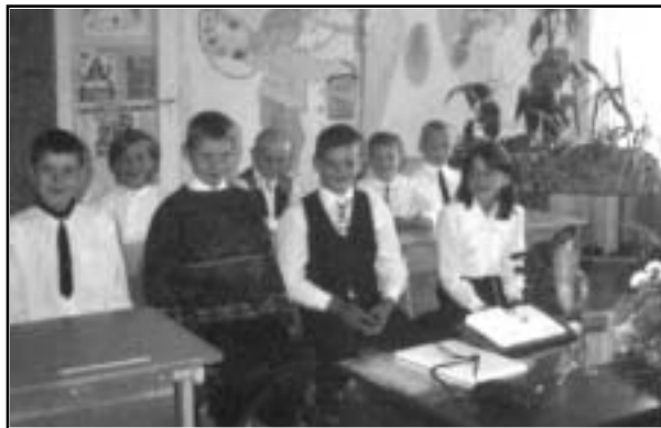
Andrioniškio mokyklos vaikučiai pamokų metu